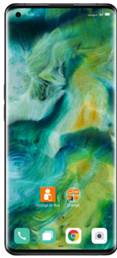
OPPO Find X2 Pro 5G (2) : DAS tête : 0,883 W/kg DAS tronc : 1,149 W/kg DAS membres : 2,465 W/kg