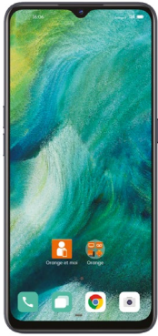
OPPO Find X2 Lite 5G (2) : DAS tête : 0,88 W/kg DAS tronc : 1,26 W/kg DAS membres : 2,40 W/kg