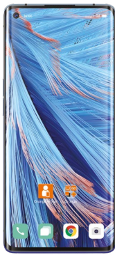
OPPO Find X2 Neo 5G (2) : DAS tête : 0,825 W/kg DAS tronc : 1,292 W/kg DAS membres : 2,283 W/kg